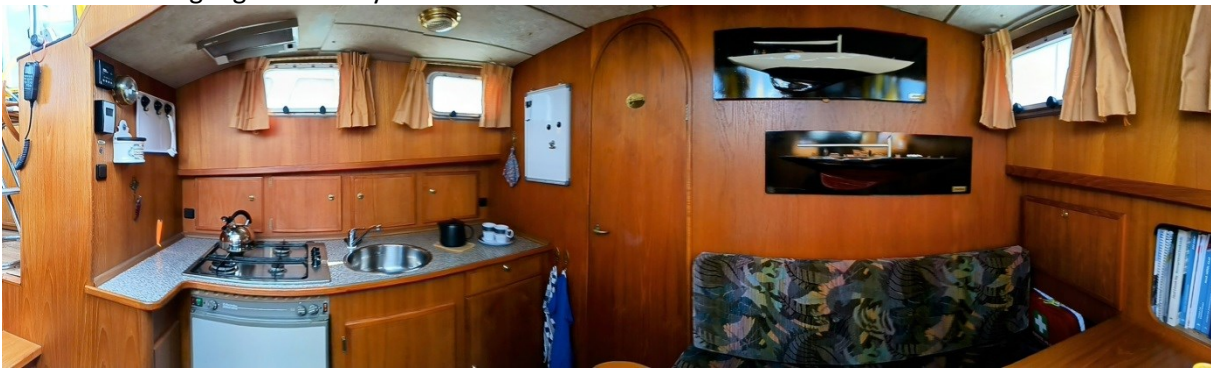
Zum Vorschiff mit Pantry und Dinette