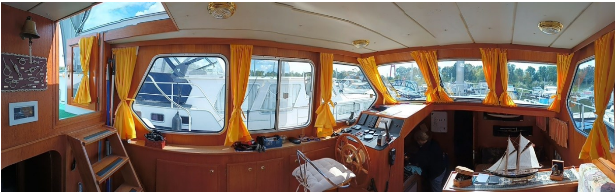
Niedergang zum Salon mit unterem Steuerstand