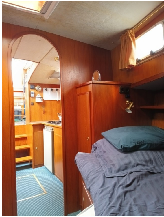
Vordere Kabine mit Schränken, Schaps und 2 Kojen