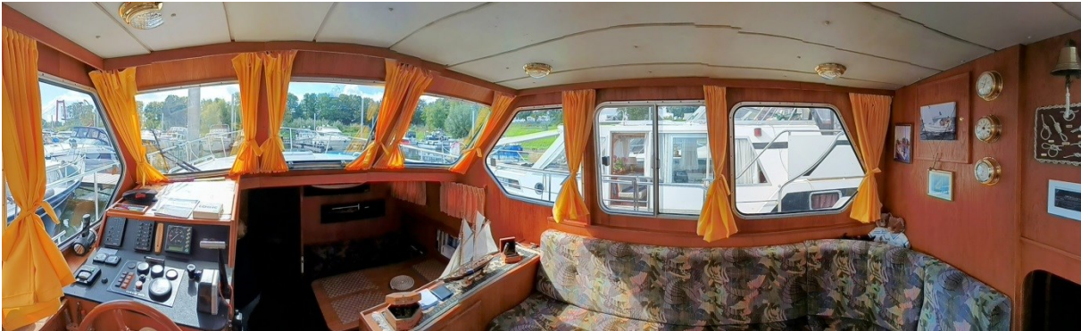
Blick auf Niedergang und Pantry